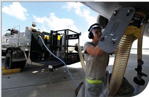
Fäkalienentsorgung (Toilet Service Unit)